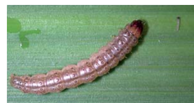
Abb. 1. Maiszünsler: Männchen (oben), Weibchen (Mitte) und Larvenstadien L1 und L5