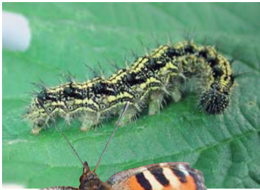
Abb. 4: Kleiner Fuchs mit Larve