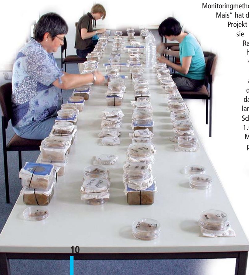
Abb. 3: Zucht der auf den Feldern als Larven gesammelten und überwinterten Maiszünsler als Einzelpaare und Inzuchtlinien

den. Ein großflächiger Bt-Maisanbau könnte auch beim Maiszünsler eine solche Entwicklung begünstigen. Dem muss vorgebeugt werden.