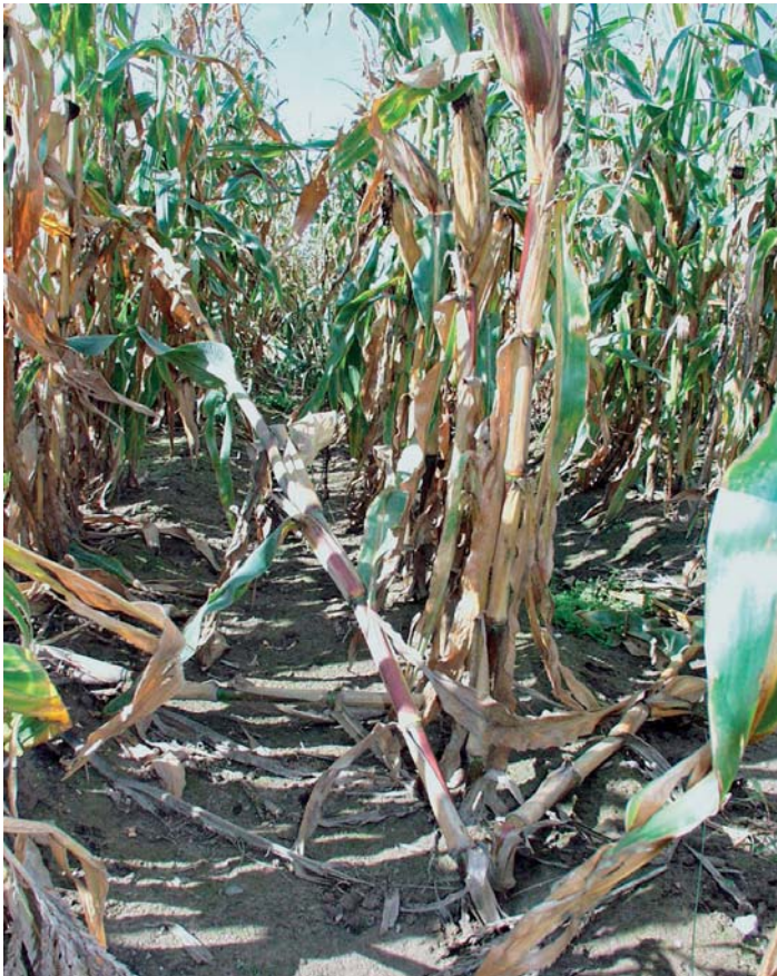
Abb. 2: Vom Maiszünsler befallenes Feld (links) im Vergleich mit einem Bestand Bt-Mais (rechts)

Ein Anbau von Bt-Mais unterscheidet sich von einer (in der Praxis im Mais selten vorgenommenen) Spritzung von B.t. -Präparaten vor allem dadurch, dass die Maispflanzen permanent B.t. -Toxin in allen grünen Pflanzenteilen, aber auch im Pollen und in geringer Menge auch in den Wurzeln produzieren. Damit ist die Expositionszeit des Toxins wesentlich verlängert, was die Wirkung gegen den Schädling verbessert. Außerdem liegt das Toxin in den Pflanzenzellen nicht in kristalliner Form vor, sondern gelöst. Damit ist ein erster Aktivierungsschritt der Toxine (der natürlicherweise im Insektendarm erfolgen würde) bereits vorweggenommen. Das in den Pflanzen produzierte Toxin wird auch