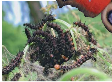
Abb. 5: Tagpfauenauge mit Larven

Da der Maispollen schwer ist und deshalb nur selten und in geringer Zahl weiter als 10 m verdriftet wird, ist nicht zu erwarten, dass Schmetterlingsbestände durch