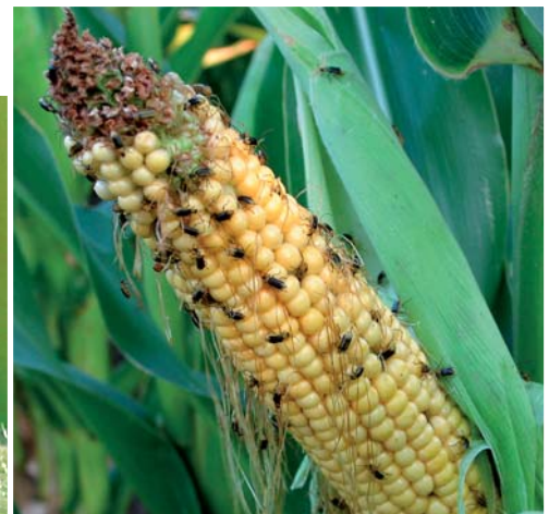
Abb. 7: Der Westliche Maiswurzelbohrer – in den USA einer der wirtschaftlich wichtigsten Schädlinge – ist auch nach Europa eingeschleppt worden. Die Fotos zeigen einen Bestand in Ungarn