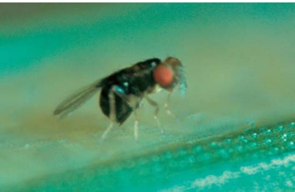
Abb. 6: Die nur 1 mm kleine Trichogramma -Schlupfwespe parasitiert Eier des Maiszünslers

dass Trichogramma einzelne Pollenkörner an- oder auffressen. Es ergaben sich aber keine signifikanten Unterschiede zwischen Bt-Mais und konventionellen Sorten bei der Lebensdauer der Weibchen oder ihrer lebenslangen Eiablageleistung.